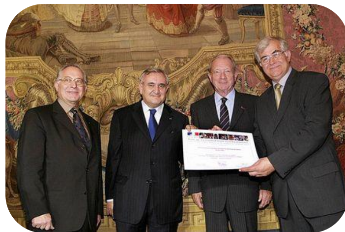
Wręczenie nagrody przez Jeana-Pierre'a Raffarina Kanclerzowi MWSLiT

Uczelnia została uhonorowana nagrodą premiera Francji: Jeana-Pierre'a Raffarina za najlepszy projekt edukacyjny w wymiarze europejskim, wśród 92 złożonych projektów z całego świata.